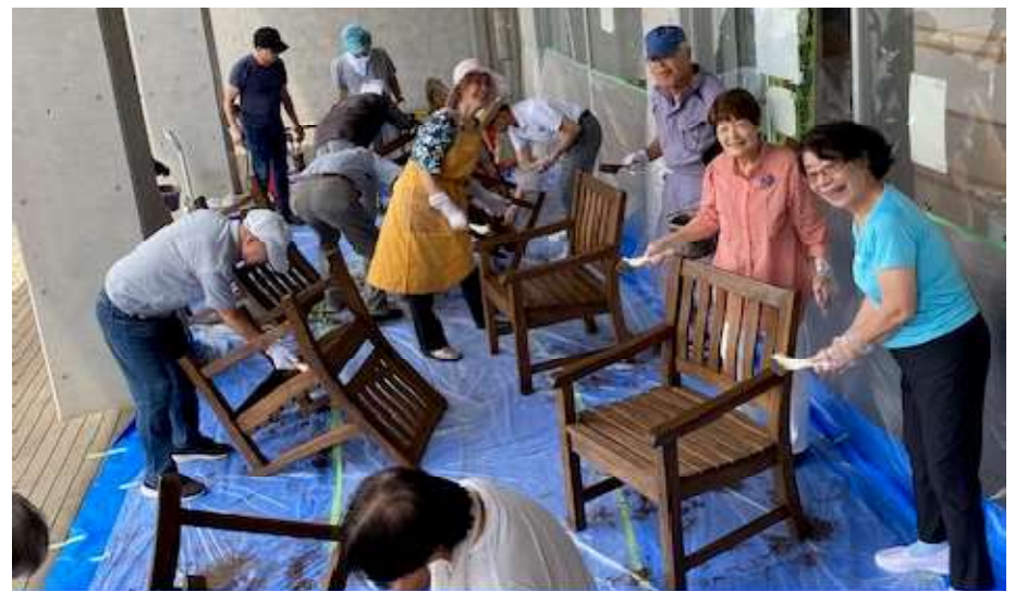
2024度7月公民館で塗装の2回塗り