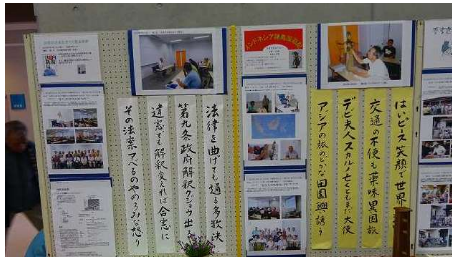
2016年3月実施した講座内容の展示