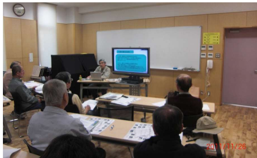
2011年11月田中正造講座