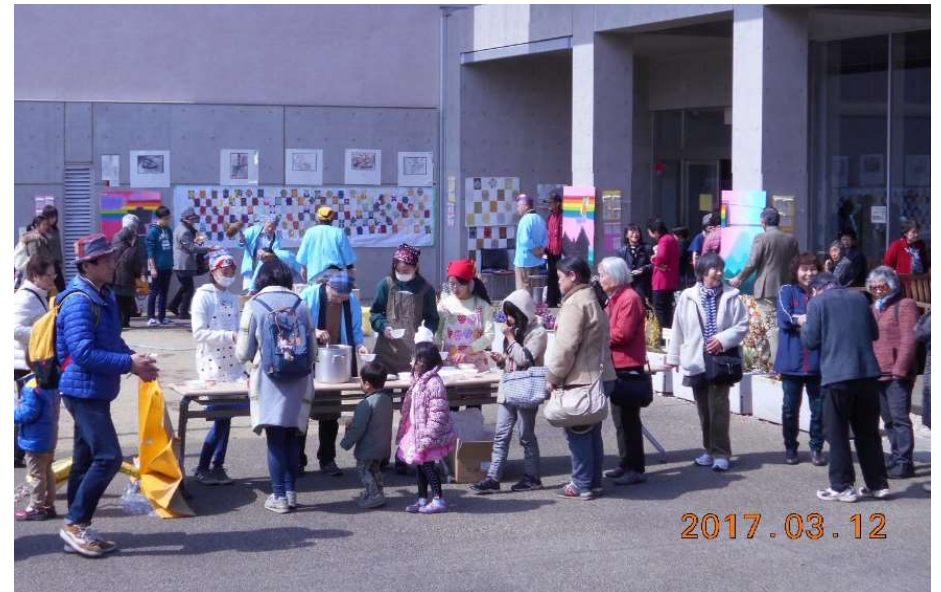
2017年3月お餅と豚汁の配布