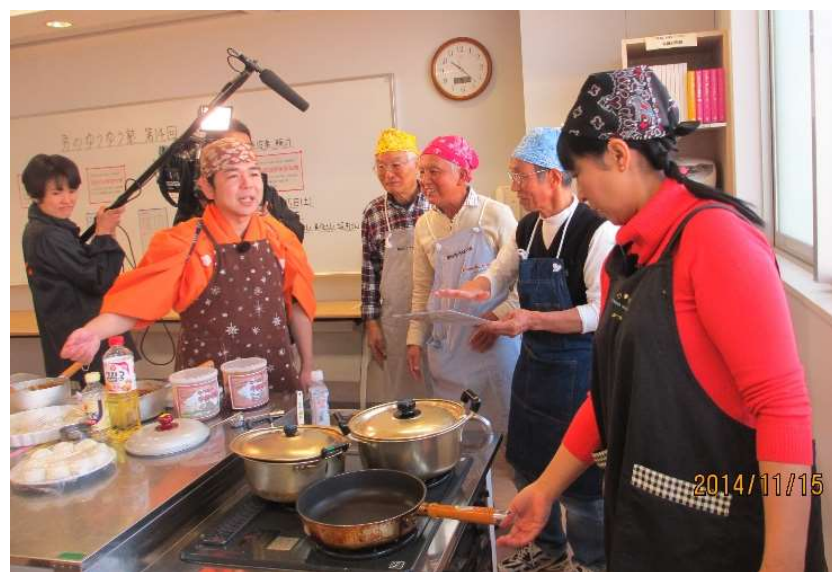
2014年11月手前味噌出来上がり