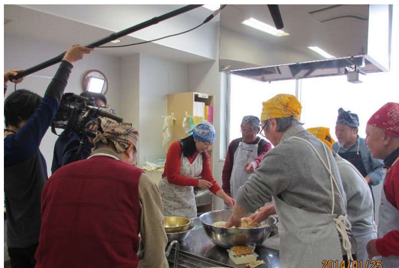
2014年1月jcomと一緒に味噌づくり