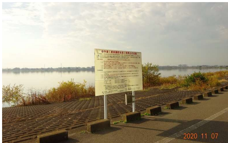
2020年11月渡良瀬遊水池見学