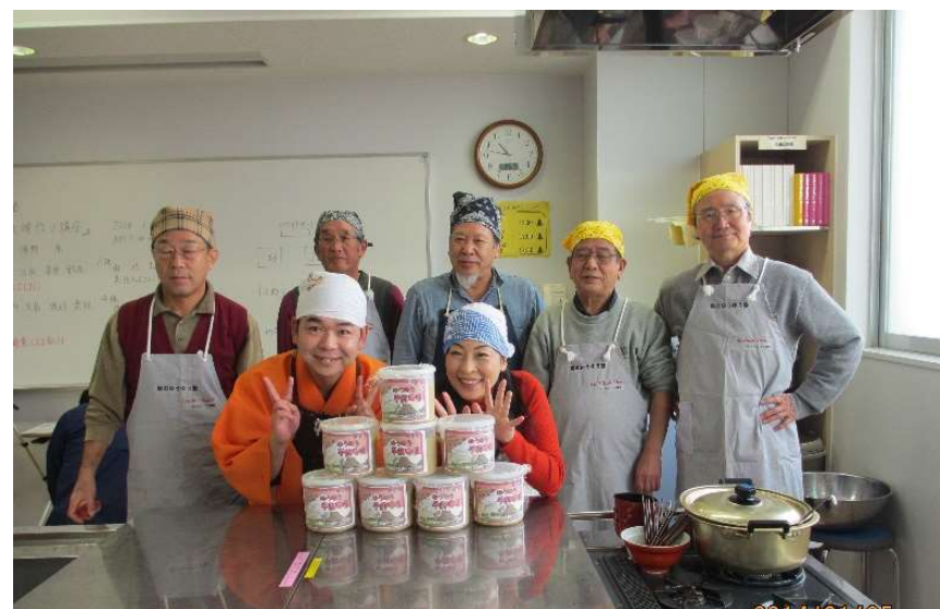
容器に入れて約10ヶ月保存