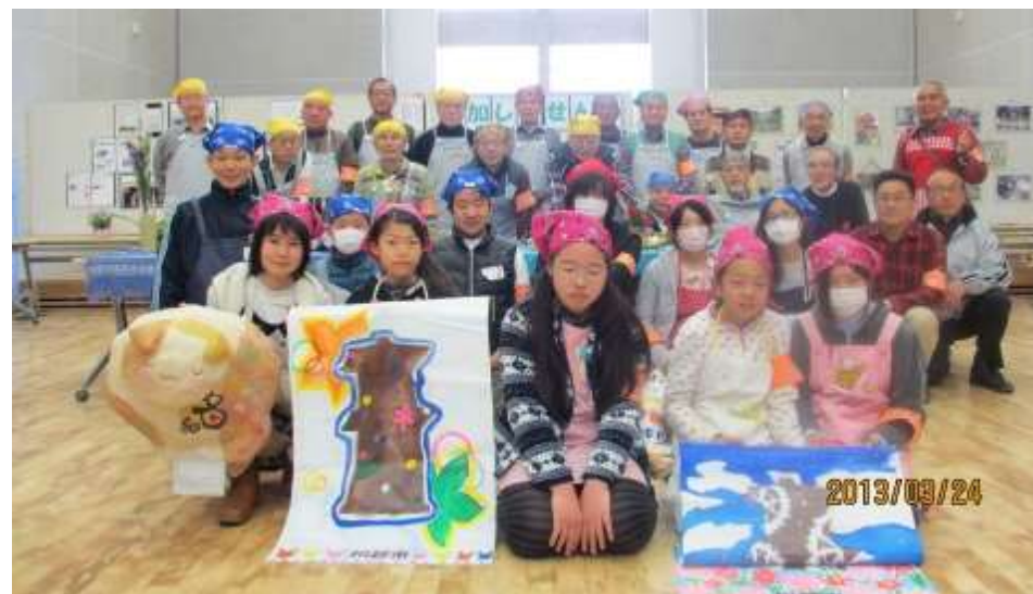
2013年3月地元中学生との交流