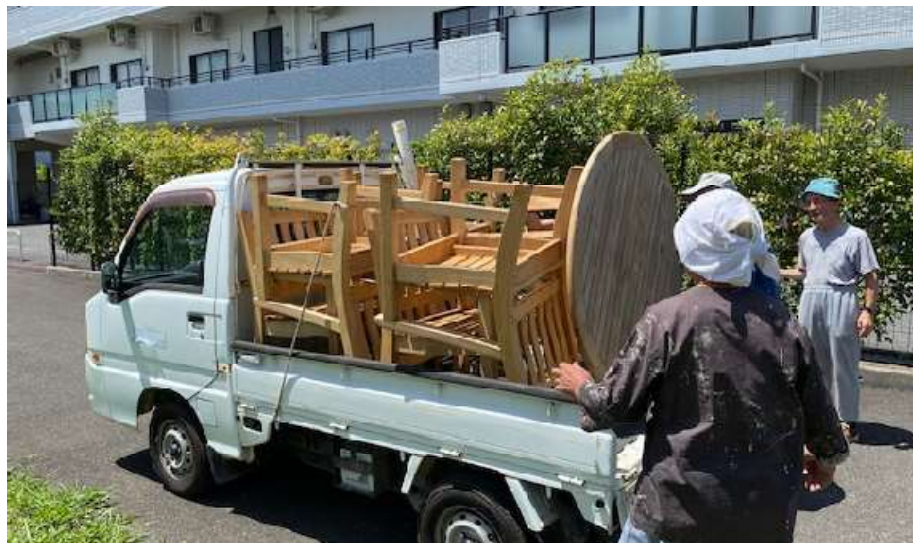
2024年7月田嶋作業場から公民館へ