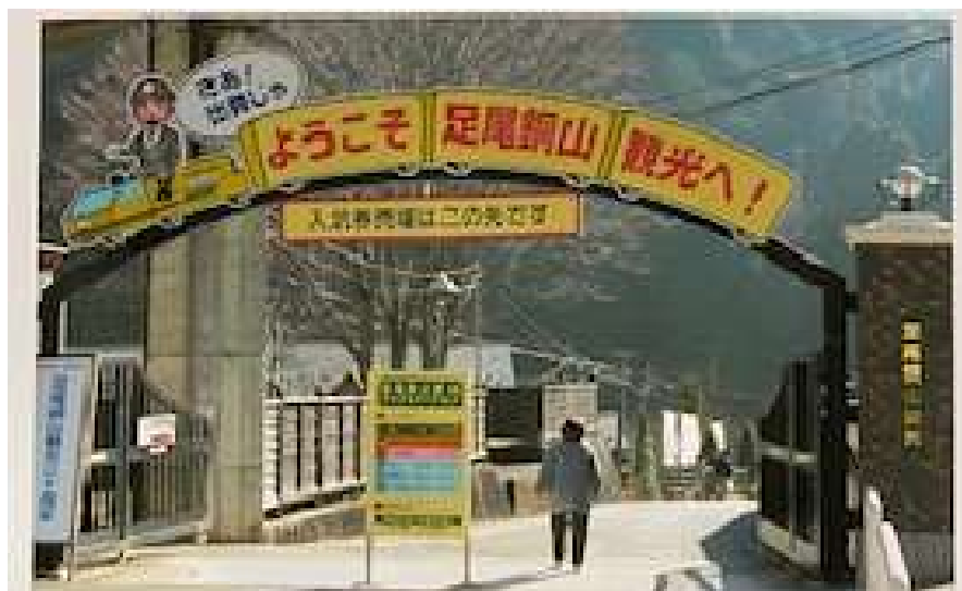
2010年11月足尾銅山見学