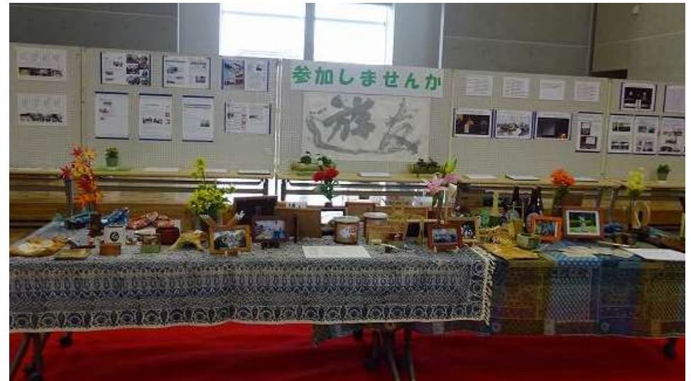
2016年3月製作した作品の展示