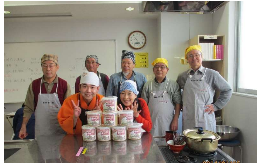
容器に入れて約10ヶ月保存