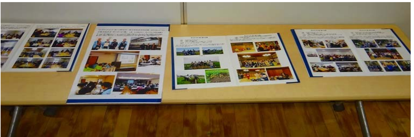
海外旅行のアルバムの展示(ウズベキスタン、レバノン、ヨルダン、シリア、イラン、中国シルクロード)