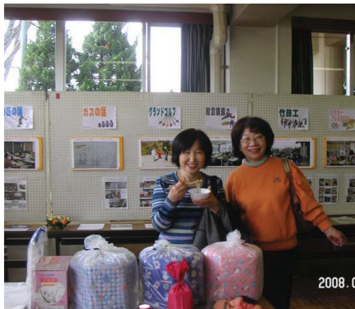
参加してくれた知人達です