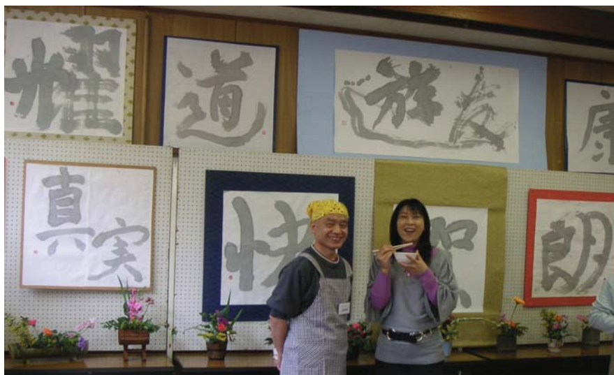
川越ケーブルテレビ松並アナウンサー