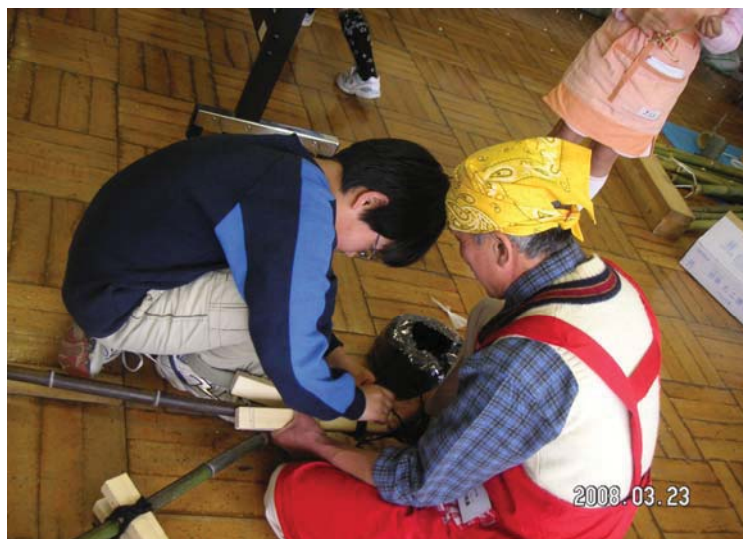
竹細工コーナーです