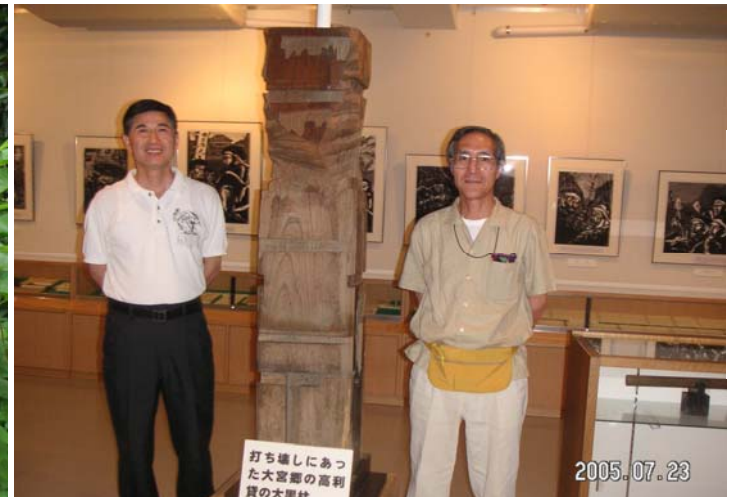
打ち壊しにあった高利貸しの大黒柱