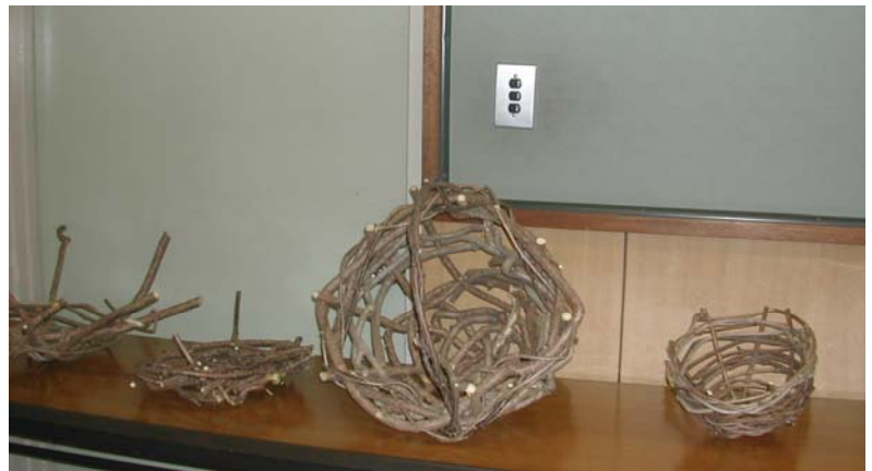
講演に合わせて、午前中に作った「蔓かご」「凧」の作品です。