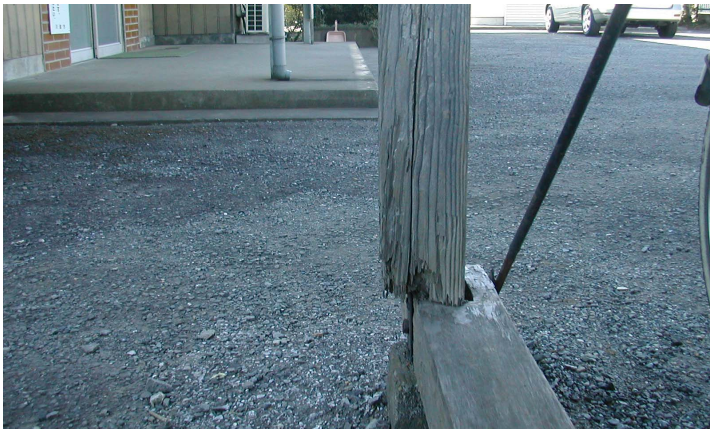
柱の補強、完成です！