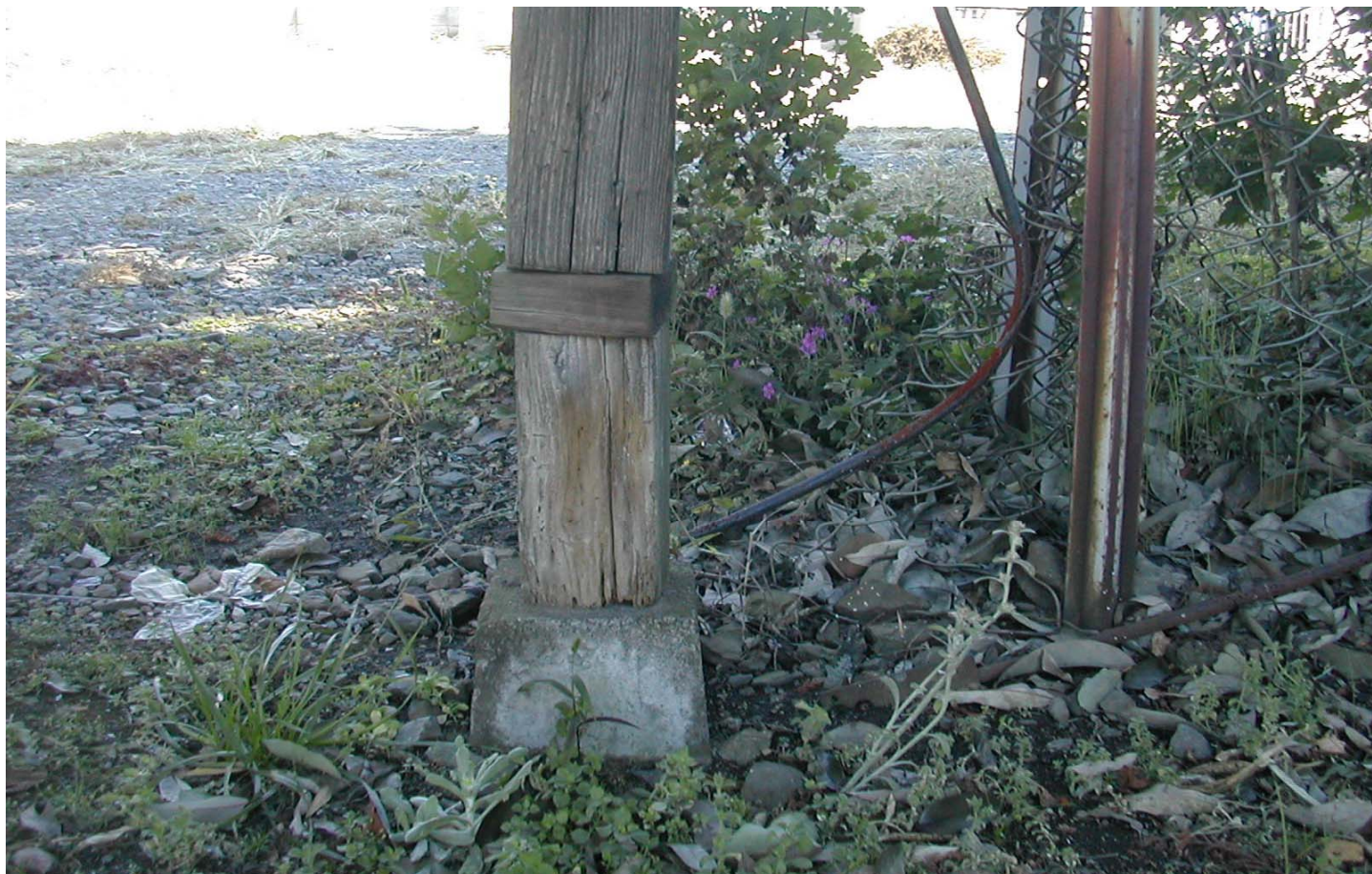
柱の補強、完成です！