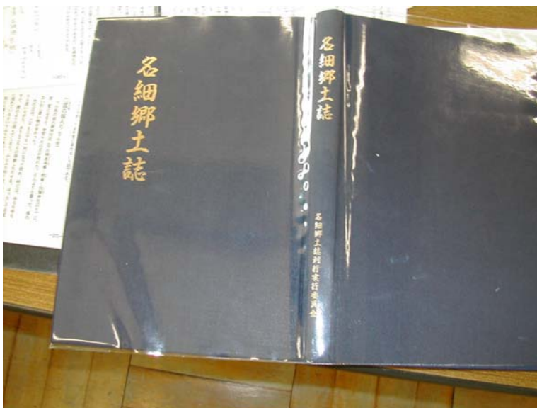
「名細郷土誌」 各班に配布しテーマを決めて調べる