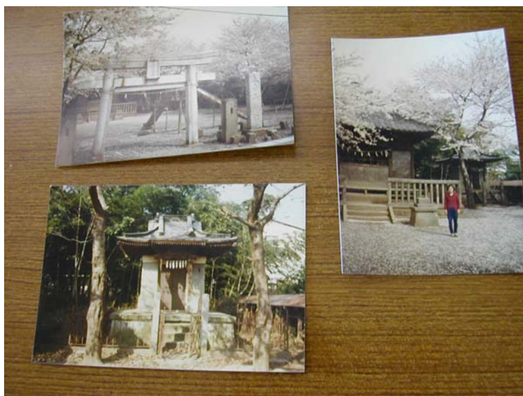
「八坂神社」 戦後取り壊す予定の「奉安殿」(天皇を奉った)の建物を移築した貴重な神社