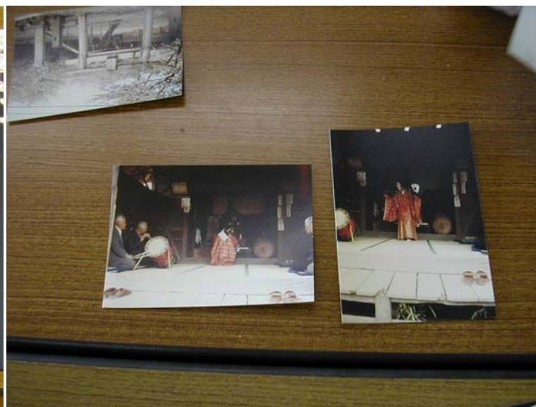
白山神社の神楽奉納、坂戸の「住吉神社」の神楽師