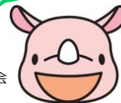
彩の国コミュニティ協議会 マスコット「サイコミ君」